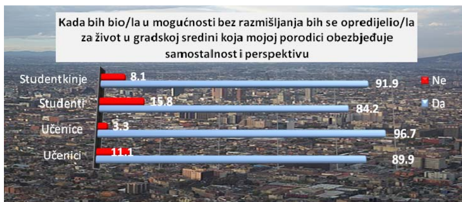
Grafikon br. 3

Aspiracije mladih i dalje se uglavnom vezuju za život u gradu, odnosno za život izvan seoske sredine, jer selo u očima mladih ljudi iz grada danas ne predstavlja psihosocijalni oslonac i element njihovog identiteta, što ima izrazito nepovoljne ne samo psihosocijalne već i društvene posljedice. Na isto ponuđeno pitanje sa izmijenjenim modalitetom koji je umjesto seoske upućivao učenike i studente na gradsku sredinu u Grafikonu br. 3 smo dobili rezultat gdje se za potvrđan odgovor na ovu tvrdnju opredijelilo očekivanih 91,7% naših ispitanika. Ono što je statistički značajno jeste ukazati na podatak da se za gradsku sredinu ponovo više opredjeljuju pripadnice nježnijeg pola, nego što je to slučaj sa muškarcima, koji u više od 13% slučajeva ne bi odabrali gradsku sredinu za stalno mjesto svoga boravka i ako bi im ona omogućila sigurnost porodice.